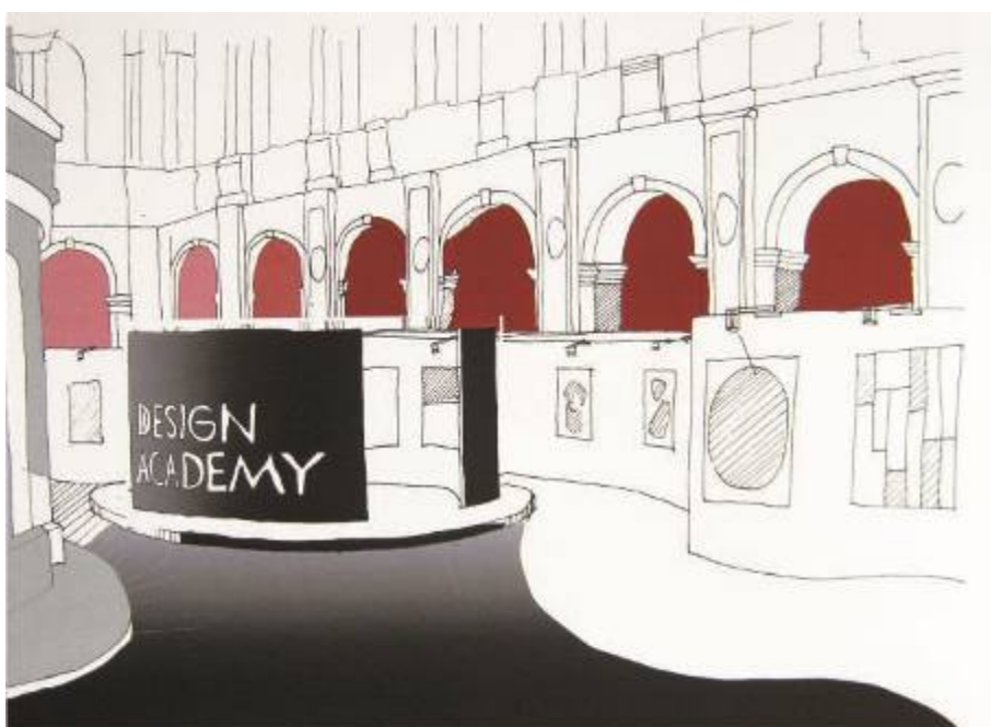
Общий вид интерьера (перспектива). Тема «Выставочное пространство».