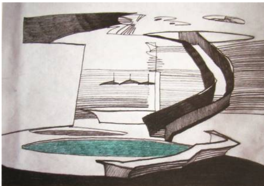
Общий вид интерьера (перспектива). Тема «Акваклуб».