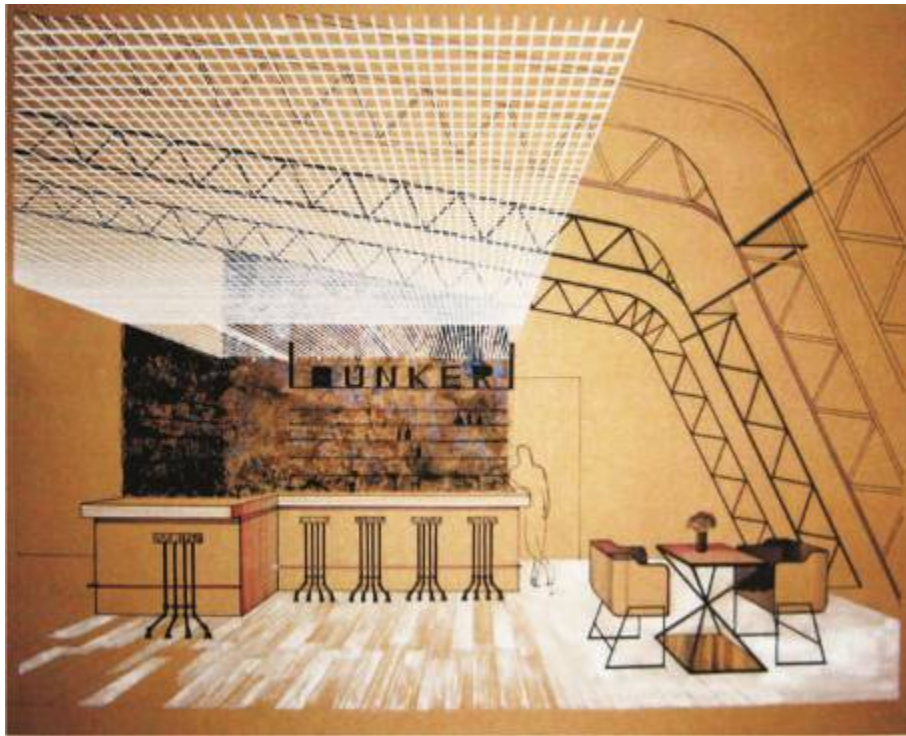
Общий вид интерьера (перспектива). Тема «Интерьер кафе».