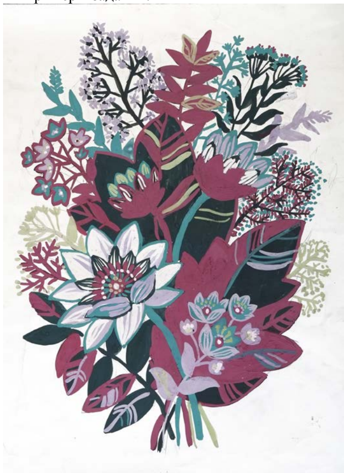
Композиция на тему «Букет цветов»