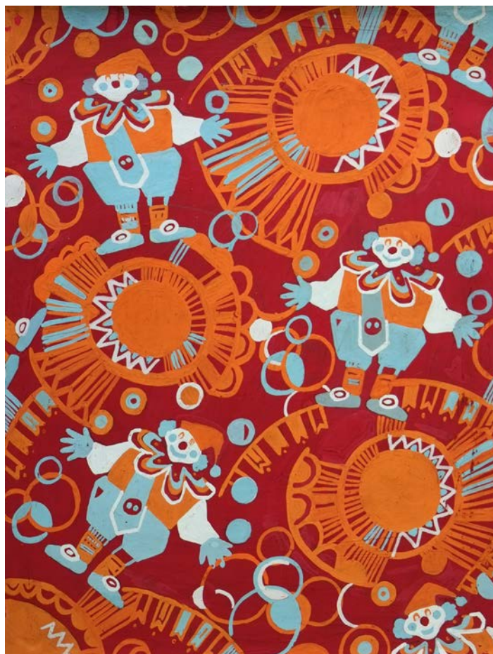
Декоративная композиция с равномерным заполнением плоскости «Цирк»