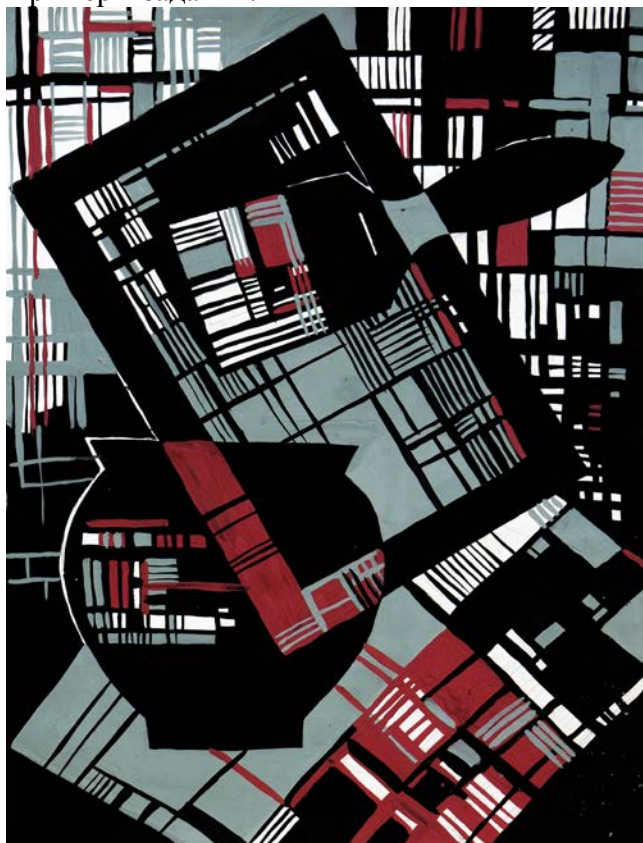
Композиции со стилизованными предметами, дополненная геометрическим орнаментом