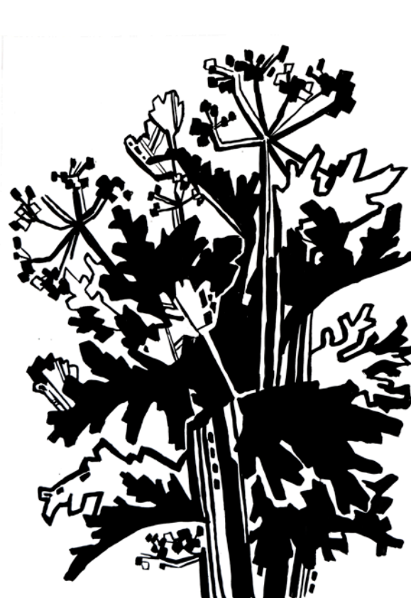
Композиция на тему «Букет цветов»