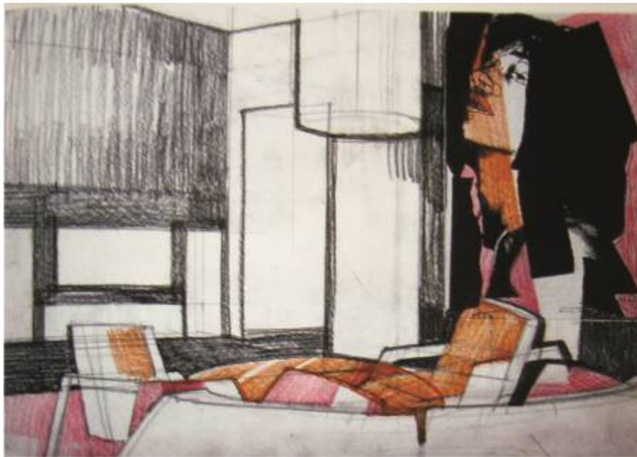
Общий вид интерьера (перспектива). Тема: «Жилой интерьер».