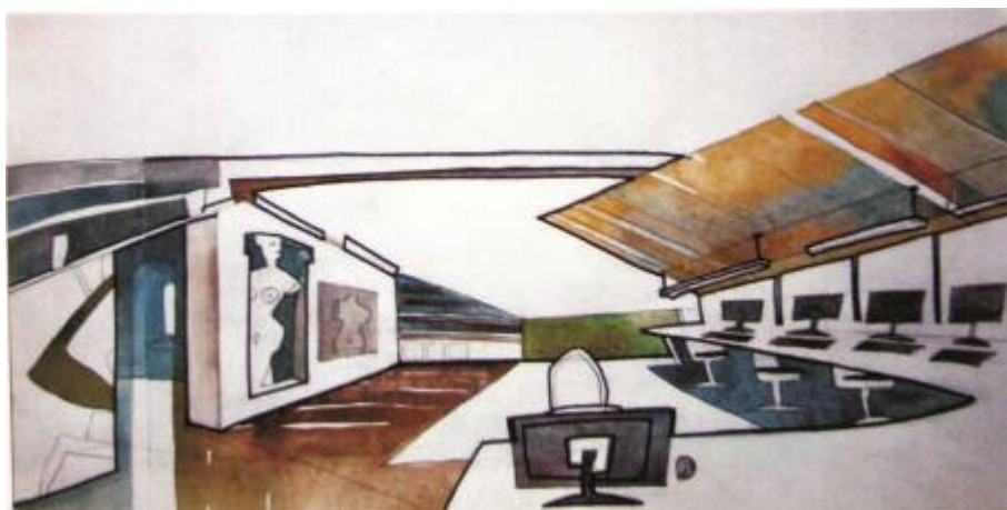
Общий вид интерьера (перспектива). Тема «Студия дизайна».